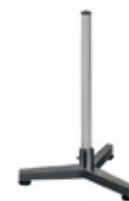
Colonne en acier peint